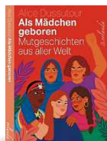
▶ Alice Dussoutour Als Mädchen geboren Mutgeschichten aus aller Welt Orlanda, 167 Seiten, 23 Euro, ab 11 Jahre

Wie fühlt es sich für Mädchen an, von ihren Mitschülern in ein fieses Bewertungssystem gesteckt zu werden? Und vor allem: Wie wehrt frau sich dagegen? „Die kleinen Königinnen“ ist ein Co-