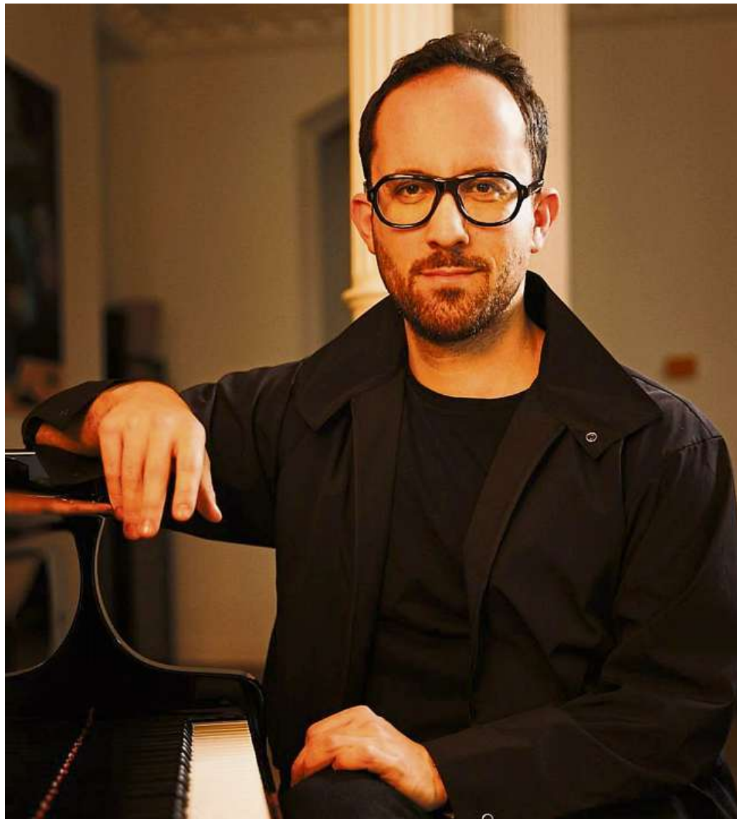
Der Pianist Igor Levit.

Das fünfte Klavierkonzert und die Eroica, die beiden großen Es-Dur-Orchesterwerke des Komponisten, hat man sich zum Auftakt vorgenom-