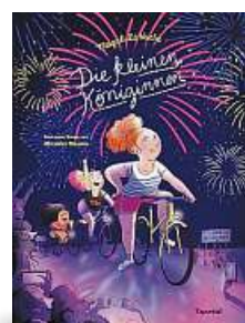
▶ Clémentine Beauvais/Magali Le Huche Die kleinen Königinnen Reprodukt, 156 Seiten, 29 Euro, ab 12 Jahre

mic über drei Außenseiterinnen, die aufgrund ihres Aussehens zur „Wurst des Jahres“ in Gold, Silber und Bronze gewählt wurden. Anstatt Trübsal zu blasen, unternehmen sie in den Sommerferien eine mehrwöchige Fahrradtour nach Paris mit einem bestimmten Ziel ... Überaus witzig und ebenso klug wie