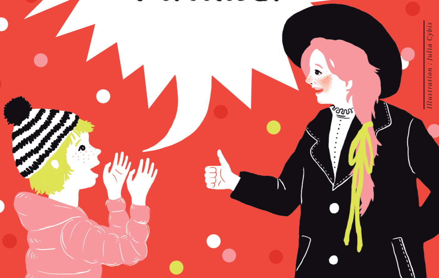
Illustration : Julia Cybis

J'ai une voix et je n'ai pas peur de l'utiliser