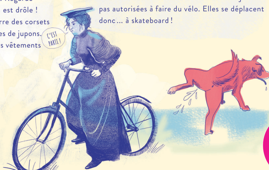
C'EST PARTI !

En 1868, en France, une course cycliste a été organisée et des femmes y ont pris part – ce qui a scandalisé le public. Cela te semble incroyable ? En Afghanistan – un pays d'Asie centrale – les femmes ne sont toujours pas autorisées à faire du vélo. Elles se déplacent donc... à skateboard !