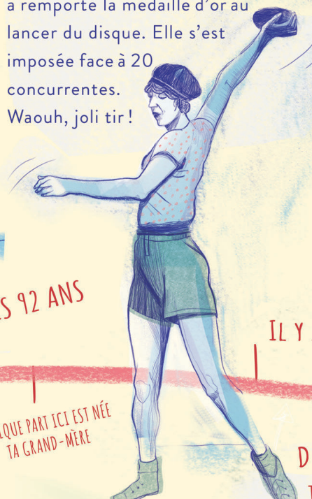
DEPUIS 92 ANS

La première fois qu'elles y ont été admises, c'était en 1928 à Amsterdam. Mais elles ne pouvaient concourir que dans cinq disciplines. À l'époque, la Polonaise Halina Konopacka a remporté la médaille d'or au lancer du disque. Elle s'est imposée face à 20 concurrentes. Waouh, joli tir!