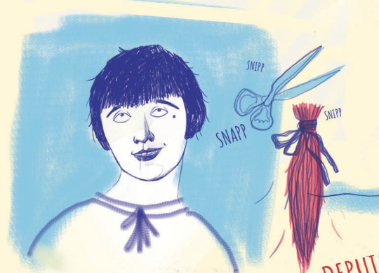
DEPUIS 105 ANS

Avant ça les femmes adultes avaient toujours les cheveux longs et les portaient attachés pour avoir l'air modestes et féminines. Mais dès les années 1920, les jeunes femmes n'en ont plus tenu compte et ont commencé à se couper les cheveux courts, à fumer, à boire de l'alcool fort et à écouter du jazz.