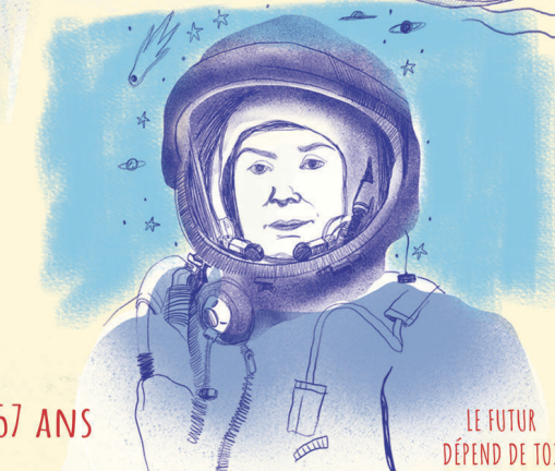
IL Y A 57 ANS

Valentina Tereshkova, une cosmonaute soviétique, a été la première femme à aller dans l'espace. À 26 ans, elle a volé toute seule en apesanteur.